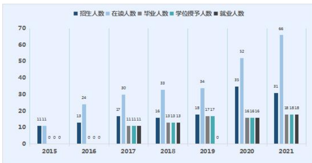
图 1.1 理学院应用统计专业 2015 至 2021 年度研究生人数

2015年度至2021年度理学院应用统计专业研究生招生、在读、毕业、学位授予以及就业人数基本情况如下图1.1所示。