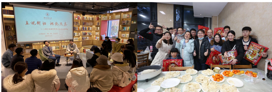
图 3.1 理学院学术社区“直视骄阳，拥抱焦虑”活动

学科之外、非专业相关以及自身未知且感兴趣的领域进行探索、交流，强调每名同学都是资源的提供者、创造者、体验者和表达者，鼓励同学们聚焦心理辅导、手工制作、科普分享、阅读交流、电影鉴赏、时间规划等内容，自主发起组织“直视骄阳，拥抱焦虑”“铜纸银墨，篆笔狮山”等学术社区系列活动。