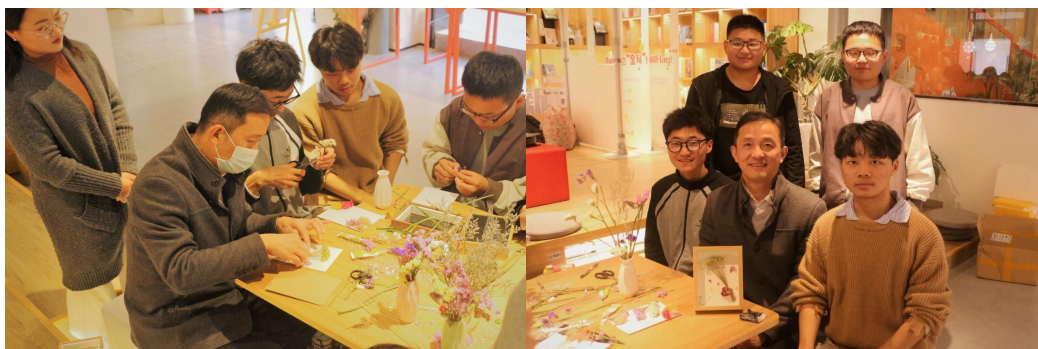
图 3.3-3.4 理学院师生插花艺术活动